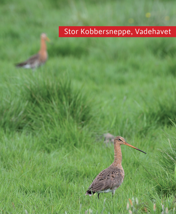
Stor Kobbersnepe, Vadehavet

Kortlægning af yngeflugle i Vadehavet (Tøndermarsken samt Rømø og Fanø) for Amphi Consult, årligt gentagne tællinger som jeg har bidraget til i en årrække, af nogle af Danmarks mest sårbare eng- og kystfugle som Stor Kobbersnepe, Engrylle, Hvidbrystet Præstekrave og Dværgterne.