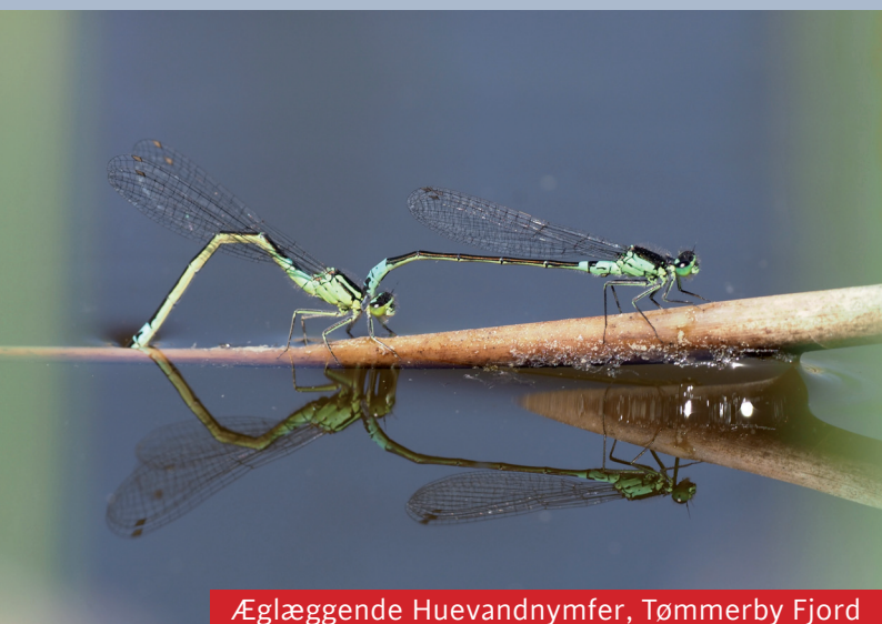
Æglæggende Huevandnymfer, Tømmerby Fjord

Kortlægning af guldsmedefau naen i Vejlerne for Aage V. Jensen Naturfond, anden sæson – projektet bidrager samtidig til det igangværende atlasprojekt . Af resultater kan nævnes, at en af de rødlistede arter, Huevandnymfe, er fundet i for Danmark hidtil usete tætheder; ialt 2950 individer blev talt, de fleste i Tømmerby Fjord og Selbjerg Vejle. Det er noget nær en hundredobling af de tal, som hidtil har været fundet i Vejlerne. Så store bestande sættes i relief af, at arten i det øvrige Danmark normalt optræder i meget beskedne antal; ingen steder udenfor Vejlerne er der i 2017 eller 2018 rapporteret flere end 60 Huevandnymfer på én lokalitet. Endvidere fandt jeg i år en ny guldsmedeart for Nordjylland, idet flere eksemplarer af Kileplet-Mosaikguldsmed sås ved Tømmerby Ringkanal. Projektet fik en flot omtale på Aage V. Jensen Naturfonds hjemmeside . En afsluttende rapport om undersøgelsen udkommer først i det nye år.