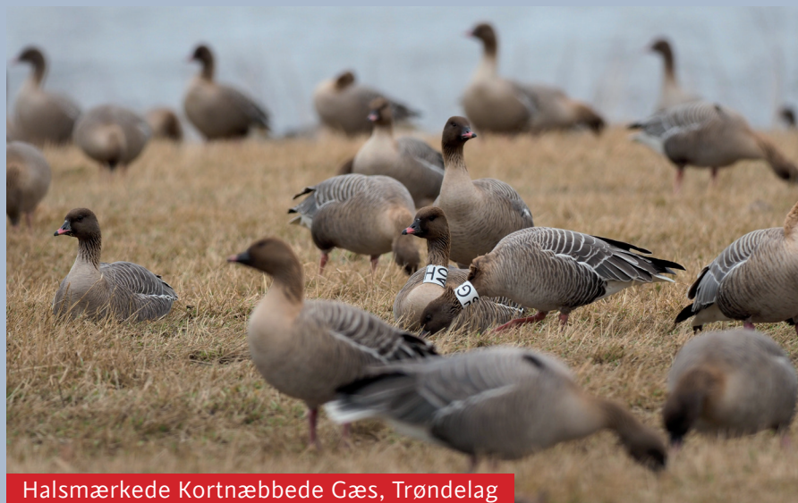
Halsmærkede Kortnæbbede Gæs, Trøndelag

For Aarhus Universitet og Norsk Institutt for Naturforskning: aflæsning af halsringmærkede individer af Kortnæbbet Gås i Nordjylland og i Trøndelag i Norge. Nogle af resultaterne er: over 750 aflæsninger i Nordjylland i det tidlige forår, 1600 i Trøndelag i april-maj og næsten 800 i Danmark i efteråret. Dermed har jeg passeret over 10.000 aflæsninger (af 1650 forskellige individer), langt de fleste foretaget siden firmaet kom med i dette projekt i 2012. Udover halsringsaflæsning har jeg bidraget med opgørelse af ungfugleandel i flokkene om efteråret, samt de to årlige internationale tællinger af arten i maj og november. Arbejdet indgår i den internationale forvaltningsplan for Kortnæbbet Gås. Læs evt. mere om projektet på AU's hjemmeside her .